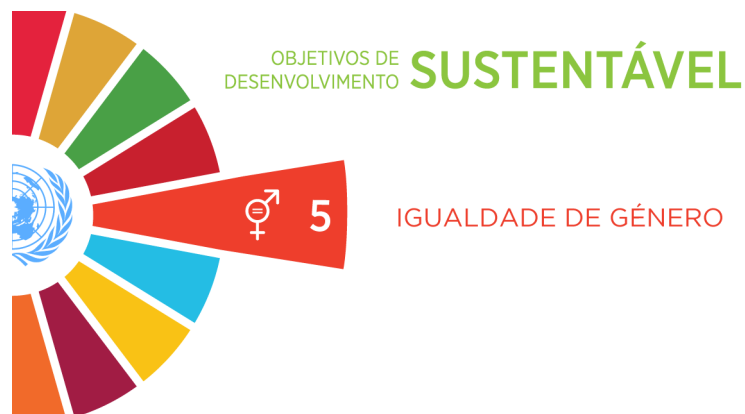
Imagem 4: ODS 5 - Igualdade de Género