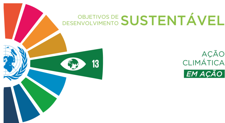
Imagem 6: ODS 13 - Ação Contra a Mudança Global do Clima