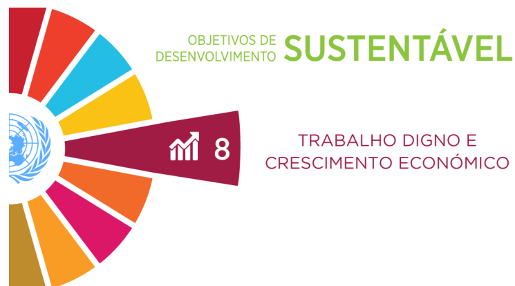
Imagem 5: ODS 8 - Trabalho Digno e Crescimento Económico