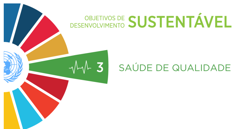
Imagem 2: ODS 3 - Saúde e Bem-estar