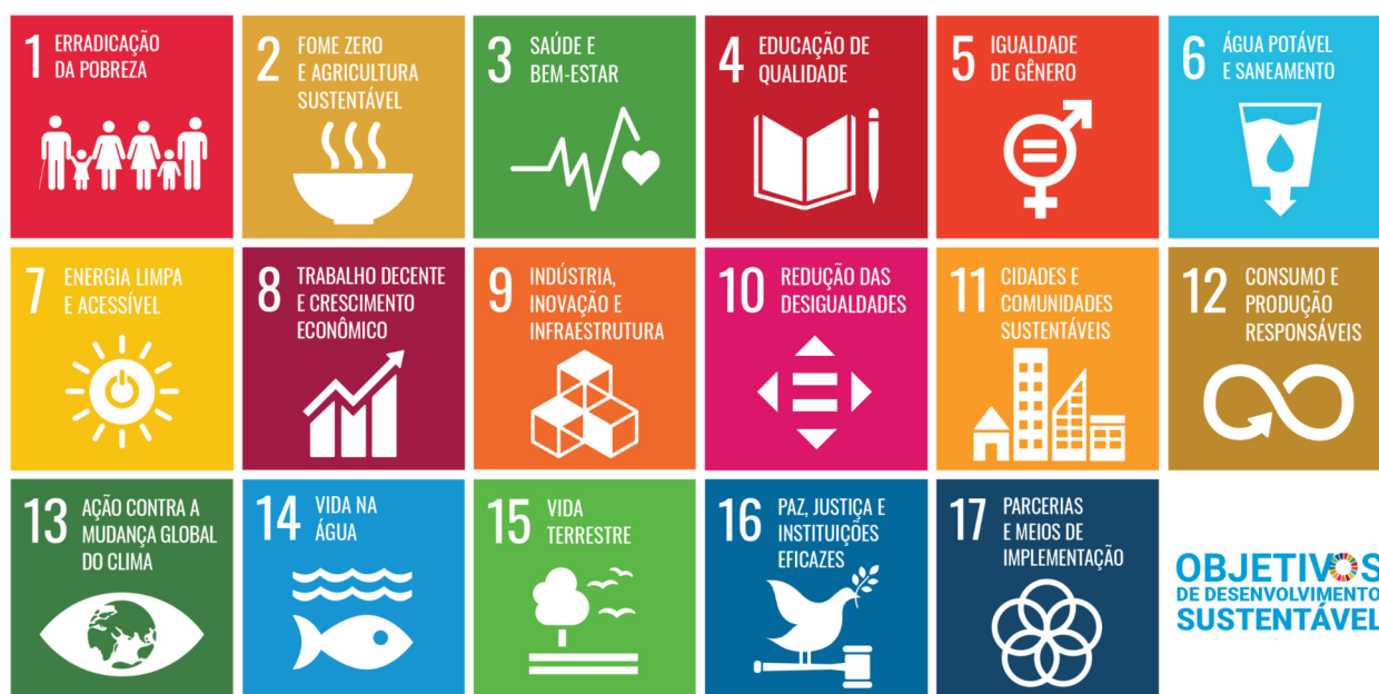
Imagem 1: Objetivos de Desenvolvimento Sustentável definidos pelas Nações Unidas

Para além de dar o nosso melhor contributo, queremos SER A MUDANÇA COM VALOR.